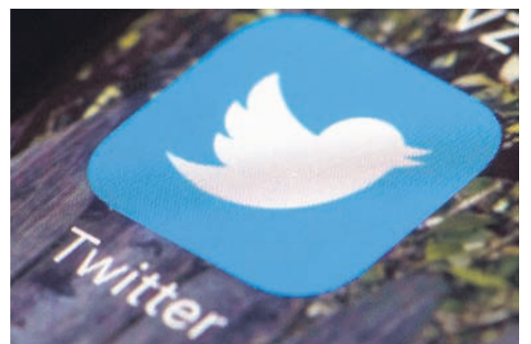
This April 26, 2017, file photo shows the Twitter app icon on a mobile phone in Philadelphia.

Trump often retweeted Cook, who had emerged as a prominent creator of right-wing memes that uses humor, often dark, to